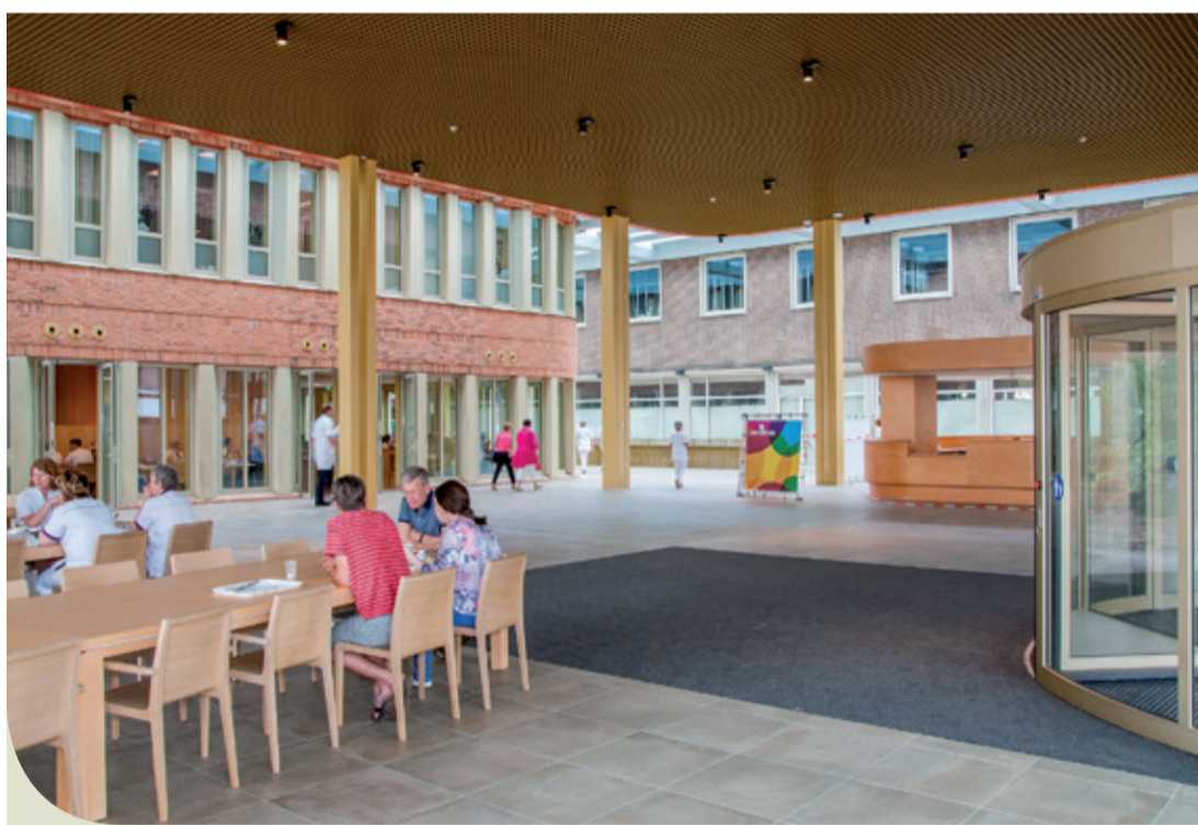
Vanaf deze zomer komt u via de nieuwe hoofdingang binnen in de nieuwe entreehal van het ziekenhuis.

De nieuwbouw van het ziekenhuis is in gebruik genomen, maar we voeren nog verbouwwerkzaamheden uit om ook bestaande poli's en afdelingen op te knappen en in een nieuw jasje te steken. Deze zomer verwelkomen we u graag via de nieuwe hoofdingang en werken we ook nog aan nieuwe bewegwijzering en aankleding!