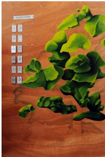
Feest- en gedenkdagen kalender