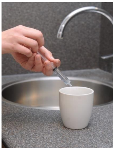
Eerst het zout water in een spuit optrekken.

Doorloop eerst de stappen aan de ene kant van de neus en dan aansluitend aan de andere kant van de neus.