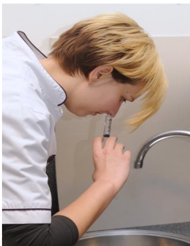
Over de wasbak buigen en spuitje tegen de neus houden.