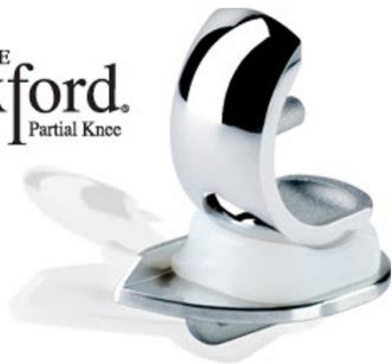
De halve knieprothese