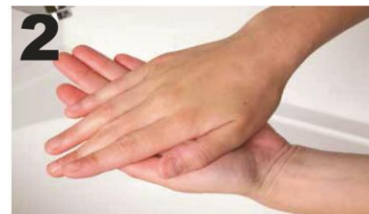
2 Wrijf beide handpalmen over elkaar