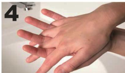
4 Wrijf handpalm tegen handpalm met gekruiste/ gespreide vingers