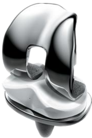
De totale knieprothese

De operatie is geen kleinigheid en het herstel vraagt veel wilskracht en inspanning van u en uw familieleden. Door een goede voorbereiding kunt u zich onnodige spanningen en teleurstellingen besparen.