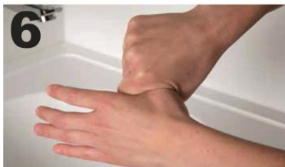
6 Wrijf draaiend met de li. duim in de gesloten re. handpalm en andersom