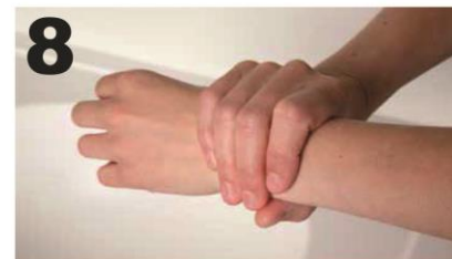
8 Draai de handpalm van de re. hand rond de pols en onderarm van de li. hand en andersom. Wrijf de handen tot ze droog zijn.