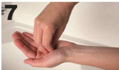
7 Wrijf draaiend links- en rechtsom, de vinger-toppen van de re. hand in de handpalm van de li. hand en andersom