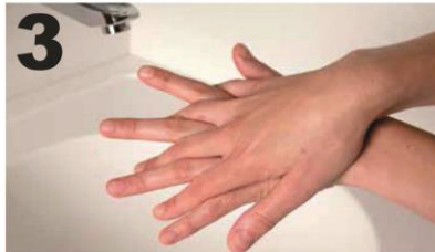
3 Wrijf, met gespreide vingers, de re. handpalm over de li. handrug en andersom