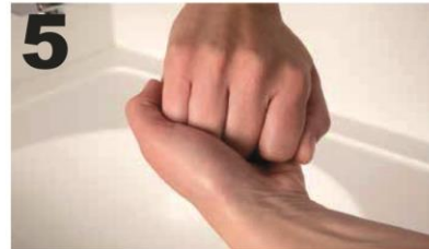
5 Wrijf de buitenkant van de vingers over de tegenoverliggende handpalm met in elkaar grijpende vingers