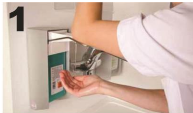
1 Breng handalcohol aan op beide handen