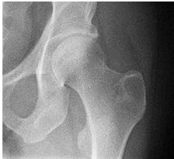
Een heupgewricht met slijtage