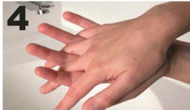
4 Wrijf handpalm tegen handpalm met gekruiste/ gespreide vingers