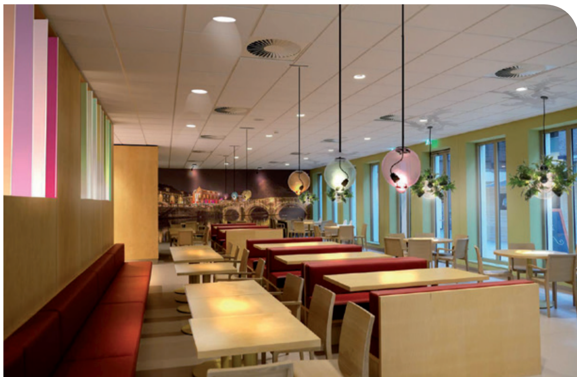
Nog dit jaar wordt de aankleding van de wachtruimtes en entreehal naar ontwerp van een binnenhuisarchitect vormgegeven. Het gaat dan om licht, planten en kunst. Ook het restaurant wordt gezellig aangekleed!

Alle nieuw- en verbouwactiviteiten in Laurentius zijn al een heel eind op weg, maar er staan er ook nog een aantal op stapel. Uiteraard hopen we dat u het met ons eens bent dat door alle verbouwingen het ziekenhuis steeds mooier wordt! In dit artikel brengen we u weer graag op de hoogte van de actuele stand van zaken.