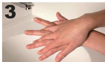
3 Wrijf, met gespreide vingers, de re. handpalm over de li. handrug en andersom