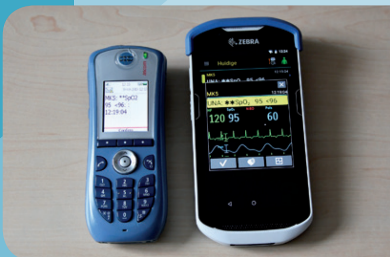
Links is de oude handheld te zien en rechts de nieuwe met uitgebreidere informatie voor verpleegkundigen.

Om geen alarmen te missen, vindt er na 44 seconden een automatische doorschakeling plaats. Tijdens pauzes kan men zichzelf afmelden op de handheld. Alarmen komen dan bij iemand anders terecht. Het actief afmelden en doorschakelen zorgt ervoor dat alarmen zo snel mogelijk bij de juiste persoon terecht komen en niet onnodig lang afduren. Ook eventuele storingen die zich voordoen tijdens het doorschakelen van het alarm vanuit de bewakingsmonitor naar de handheld zijn meteen zichtbaar. Verpleegkundigen krijgen hier namelijk een melding van. Zo weten ze dat er een storing is en kunnen ze hierop inspelen.