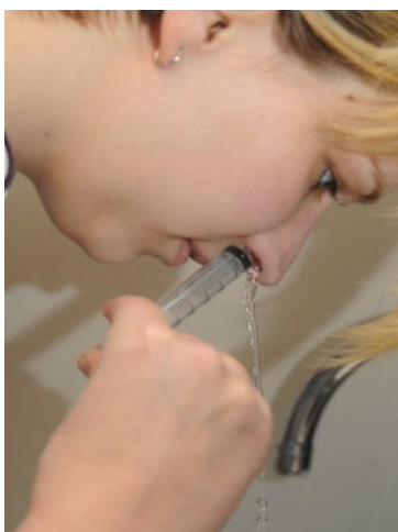
Spuit de hele spuit met het zout water snel met druk in de neus.