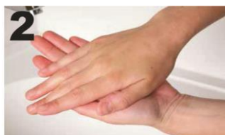
2 Wrijf beide handpalmen over elkaar