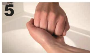
5 Wrijf de buitenkant van de vingers over de tegenoverliggende handpalm met in elkaar grijpende vingers