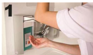
1 Breng handalcohol aan op beide handen