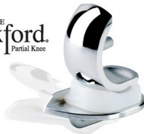
De halve knieprothese