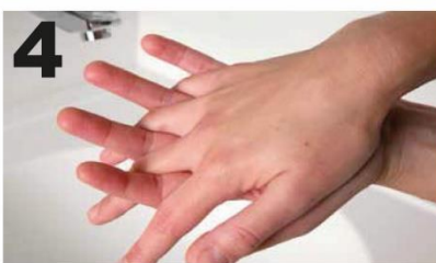
4 Wrijf handpalm tegen handpalm met gekruiste/ gespreide vingers