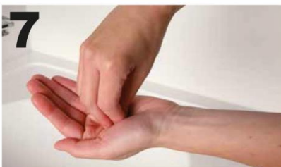
7 Wrijf draaiend links- en rechtsom, de vinger-toppen van de re. hand in de handpalm van de li. hand en andersom