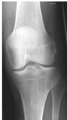
Een kniegewricht met slijtage