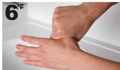
6 Wrijf draaiend met de li. duim in de gesloten re. handpalm en andersom