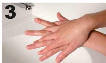
3 Wrijf, met gespreide vingers, de re. handpalm over de li. handrug en andersom