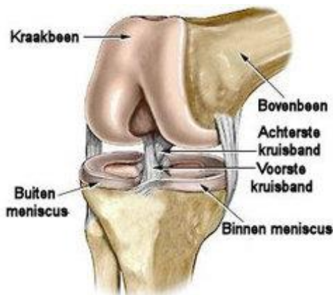
Een gezond kniegewricht

Het kniegewricht bestaat uit twee botdelen, het scheenbeen en bijbeen. De uiteinden daarvan zijn bedekt met een laagje kraakbeen, zodat de knie soepel beweegt. Dit kraakbeen laag is elastisch en kan schokken en stoten opvangen. Als een kniegewricht ernstig beschadigd of versleten is, is vervanging van het gewricht door een prothese vaak de enige oplossing.