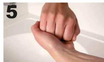
5 Wrijf de buitenkant van de vingers over de tegenoverliggende handpalm met in elkaar grijpende vingers