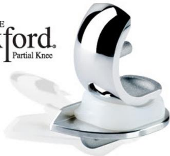
De halve knieprothese