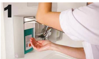
1 Breng handalcohol aan op beide handen