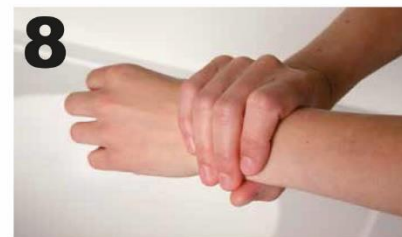
8 Draai de handpalm van de re. hand rond de pols en onderarm van de li. hand en andersom. Wrijf de handen tot ze droog zijn.